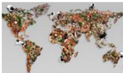
غذا، تغذیه، فرهنگ